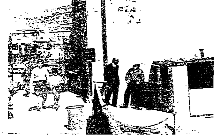
موقف السيارات التيسيم في رحلة - من مراسل «الانوار» : بعد مفاوضات طويلة بين اهل البقاع وبين بلدية البقاع ، تم الاتفاق على السماح للسيارات بالتوقف على طول البولفار ، ولكن ما يدعو للارتياح ان عددها في المستقبل .

يراحه رجال السير في رحلة صوبية في ثوبين موقف للسيارات على جانبي البولفار ، لا تلتزم الخبيرة الى الرابطة العلمية والتجارية . وقد سبق ان اترح على البلدية ان تستهلك بعض المقارنات على جانبي البولفار ، من اجل حل هذه المشكلة ، لكنها لم تفعل . وقد سالت «الانوار» محافظ البقاع رايه في الحل ، فقال : لقد اتخذنا قرارا بعدم السماح بتوقف السيارات على طول البولفار ، وبد ان لاحظنا ان الخبيرة تكاد تخفق في الانجاح والنهوض ، ولا يعمل ان يصر السائق نصف ساعة ليتطلع المسافة المتصاعدة بين السوي والبروني . اما المواقف فتشروع حيوي يلزمه بعض الوقت ، لاعتبارات تتصل بأوضاع البلدية المالية في مرحلة مساهم الأحداث .